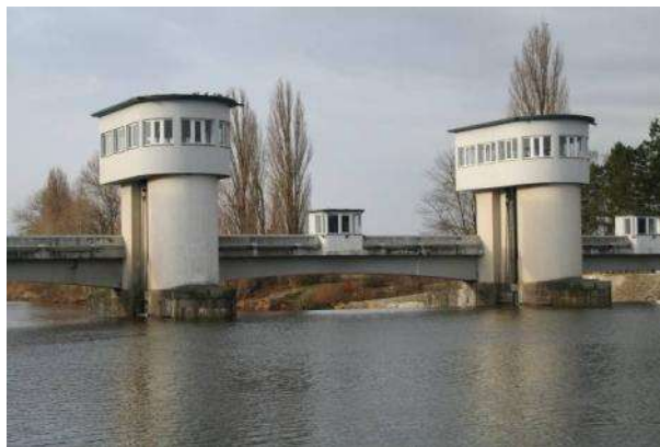
Transmise pohonu stavidla a strojovny JP (lávka, pilíře)

Do opravovaného, připraveného jezového pole bude následně namontována po dílech nová hradící konstrukce stejného typu - zdvižné stavidlo s nasazenou klapkou, vyrobená a dopravená v dílech do jímky jezového pole. Vzhledem k možnostem přístupu do jezových polí je téměř nezbytné realizovat odsun i přísun ocelových konstrukcí stavidel po vodě.